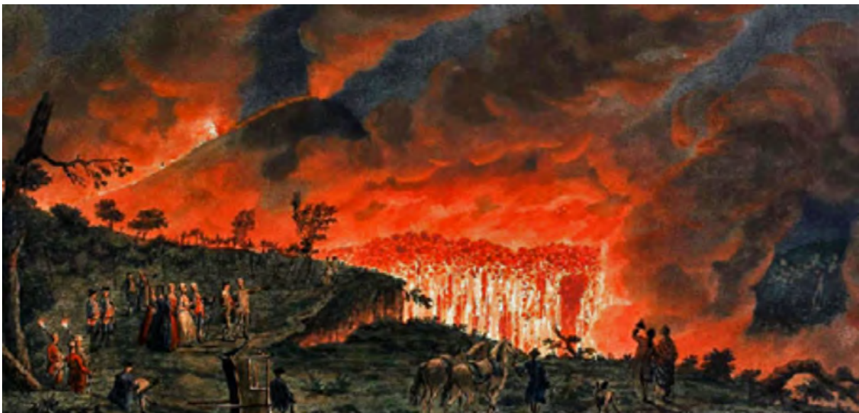
1771: Picknick mit Blick in die Küche des Vesuv - Pietro Fabris - Plate XXXVIII (1771)

"A night view of a current of lava, that ran from Mount Vesuvius towards Resina, the 11th of May 1771 when the Author had the honor of conducting their Sicilian Majesties to see that curious phenomenon" (Sir William Hamilton)