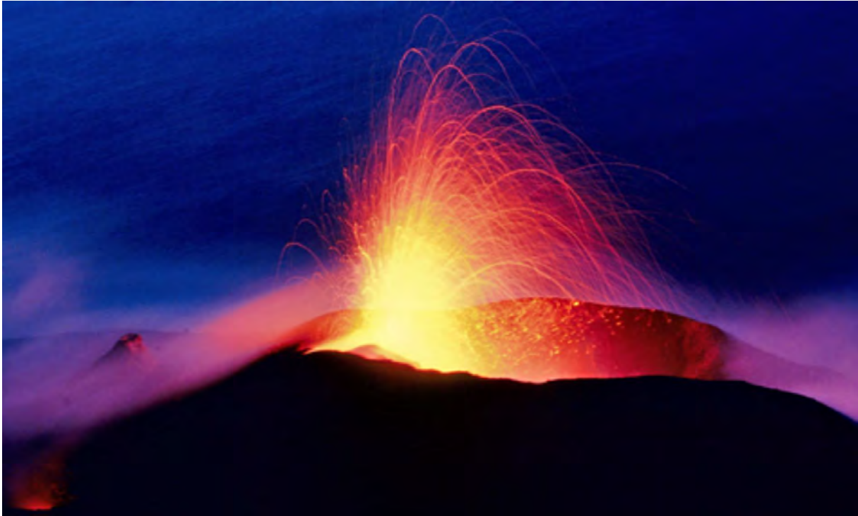
Vulkan Stromboli - 300 Ausbrüche am Tag

Der Vulkan Stromboli ist regelrecht modelliert in eine griechisch-antike Gegenwart der Empedoklischen Naturphilosophie: Feuer, Wasser, Erde und Luft. Er ragt vor Sizilien 900 Meter aus dem Tyrrhenischen Meer, gehört zur Gruppe der Äolischen Inseln (UNESCO Welterbe) und bricht wissenschaftlich dokumentiert ca. 300 Mal am Tag aus. Je nach Aktivitätsphase und Wettersituation ist daher das Zusammenspiel der „Vier Elemente“ ununterbrochen zu sehen, zu hören, zu fühlen und zu riechen. Ein Aufstieg zum Gipfel samt Blick in den Krater ist ebenso möglich wie das anspruchsvolle Wandern an des Vulkans Küste entlang.